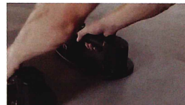
タイルや床材などの施工に