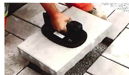
敷石・舗装工事に