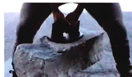
重量物の運搬・移動に