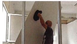
大判建材パネルの運搬に